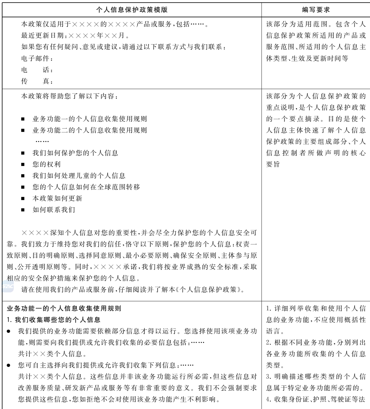
表 D.1 个人信息保护政策模板

发布个人信息保护政策是个人信息控制者遵循公开透明原则的重要体现,是保证个人信息主体知情权的重要手段,还是约束自身行为和配合监督管理的重要机制。个人信息保护政策应清晰、准确、完整地描述个人信息控制者的个人信息处理行为。个人信息保护政策模板示例见表 D.1。