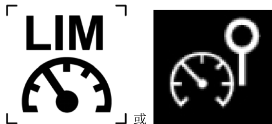
图2 车速限制信号标志