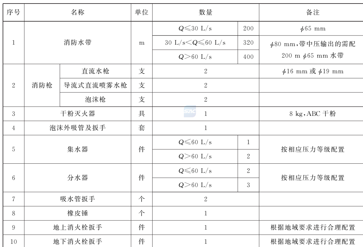
表 4 器材配备表